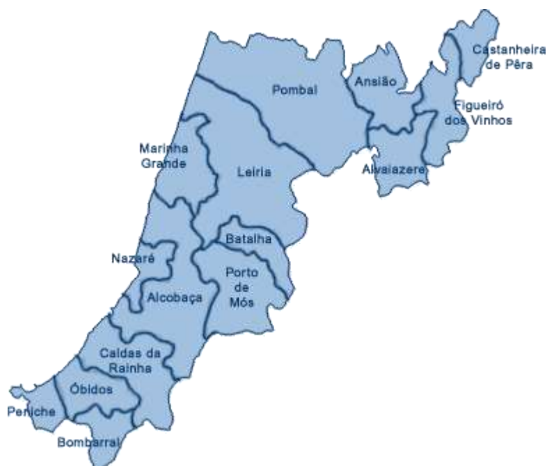
Figura 1 – Concelhos do distrito de Leiria

O ISLA-Leiria insere-se numa região que coincide com a área geográfica do distrito de Leiria (correspondente aos concelhos de Alcobça, Alvaiázere, Ansião, Batalha, Bombarral, Caldas da Rainha, Castanheira de Pera, Figueiró dos Vinhos, Leiria, Marinha Grande, Nazaré, Óbidos, Pedrogão Grande, Peniche, Pombal e Porto de Mós). Segundo os dados disponibilizados pelo PORDATA, entre 2001 e 2015 o total da população passou de 508.528 para 508.586 indivíduos, o que significa que o número total de residentes nestes concelhos se manteve estável.