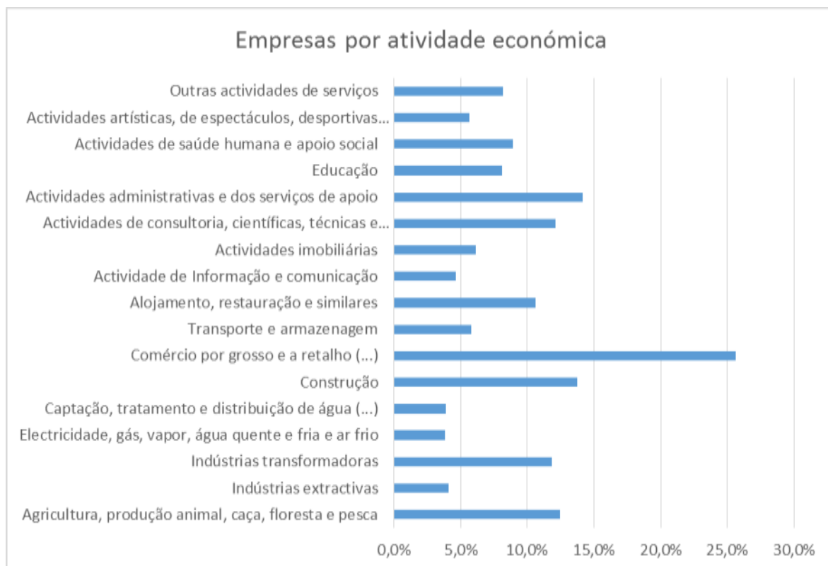
Gráfico 1 – Distribuição das empresas do distrito por atividade económica, 2014 (Fonte PORDATA)

(12,1%), as “indústrias transformadoras” (11,8%) e o “alojamento, restauração e similares” (10,6%) (gráfico 1).